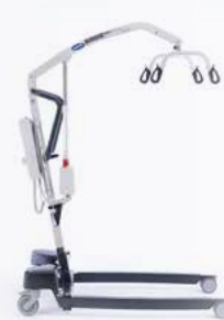
Birdie EVO XPLUS