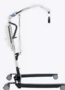
Birdie EVO COMPACT

▲ Más pequeña para una maniobrabilidad más fácil